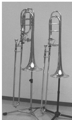
左がバス、右がテナー・トロンボーン

出番が少ないとはいえ、オーケストラの中では重要な存在です。コラールなどであたたかい和音