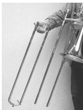
スライドを抜くとこんな感じ

毎回、演奏会のプログラムで、オーケストラで使用される楽器をひとつずつ紹介しています。次回もお楽しみに！